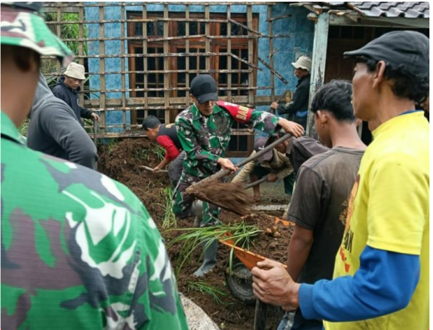
(Foto Dokumen) : Babinsa bersama masyarakat gotong royong bersihkan material longsor

MAGELANG – Hujan deras yang mengguyur sejak sore hingga malam hari menyebabkan tanah longsor di Dusun Kecitran RT. 07 RW. 02, Desa Ketundan, Kecamatan Pakis, pada Rabu (11/12/2024). Tebing setinggi 7 meter dengan